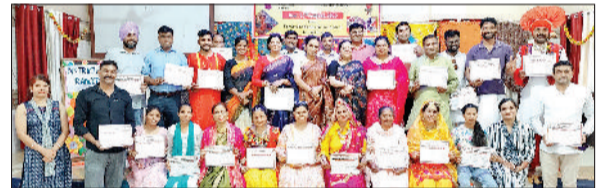
अंबाला। विभिन्न स्पर्धाओं में हिस्सा लेने वाले बच्चे स्कूली छात्र।