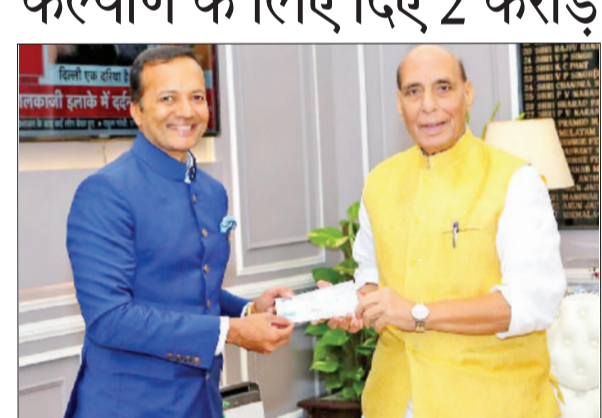
कुरुक्षेत्र। आजादी की 79वीं वर्षगांठ की पूर्व संस्था पर जिन्दल स्टील के कर्मचारियों ने अपनी देशभक्ति का परिचय देते हुए ऑपरेशन सिद्धूर की शानदार सफलता के उपलक्ष्य में प्रभावित सैनिकों और उनके आश्रितों के कल्याण के लिए 2 करोड़ रुपये दिए हैं। गौरवलाभ है कि पड़लानाम में निर्दोष पर्यटकों की हत्या के बाद भारतीय सेना के जांबाजों ने कई महानों में ऑपरेशन सिद्धूर के तहत पाकिस्तान में घुसकर अनेक आतंकी ठिकानों को नष्ट कर भारत का मान बढ़ाया था। राष्ट्र के प्रति भारतीय सेना के इस स्वतंत्रता योगदान पर जिन्दल स्टील के कर्मचारियों ने स्वेच्छा से ड्यूटी के दौरान प्रभावित सैनिकों और उनके परिवारों के कल्याण के लिए अपने एक दिन के वेतन का योगदान किया है, जो कुल मिलाकर लगभग 2 करोड़ रुपये बरतता है। कर्मचारियों के एकजुट योगदान का प्रतीक 2 करोड़ रुपये का चेक आज नई दिल्ली में कुरुक्षेत्र के सांसद और जिन्दल स्टील के चेयरमैन वजीर जिन्दल ने माननीय रक्षा मंत्री राजनाथ सिंह को औपचारिक रूप से सौंपा।