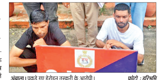
अंबाला। पकड़े गए हेरोइन तस्करों की आरोपी।

पुलिस नशा तस्करों के खिलाफ निरंतर कार्रवाई कर रही है। अब पुलिस ने हेरोइन तस्करों के मामले में दो आरोपियों को काबू किया है। आरोपियों के कब्जे से पुलिस ने डेढ़ करोड़ रुपये कीमत की 257 ग्राम 2 मिलिग्राम हेरोइन जब्त की है। अब पुलिस आरोपियों से गहन पूछताछ कर रही है। पुलिस द्वारा नशे