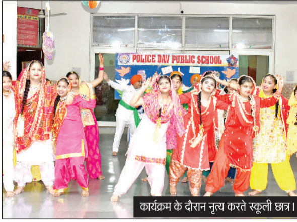
कार्यक्रम के दौरान नृत्य करते स्कूली छात्र।

पुलिस डीएवी पब्लिक स्कूल में कृष्ण जन्माष्टमी के उपलक्ष्य में आयोजित हुआ मठ्य कार्यक्रम